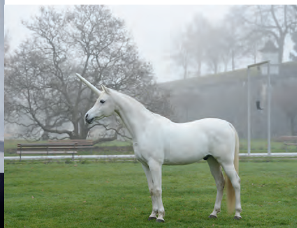
Lorenzo Salafia, Where do unicorns go? , 2013–2022