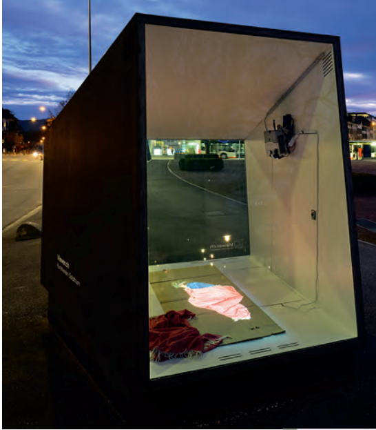
Annatina Graf: Another World , 2022