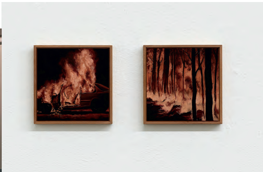
Mattania Bösiger, burning_8 und burning_5 , 2022