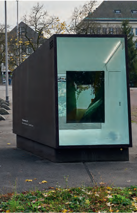
Sabine Hagmann: immediate beauty , 2022