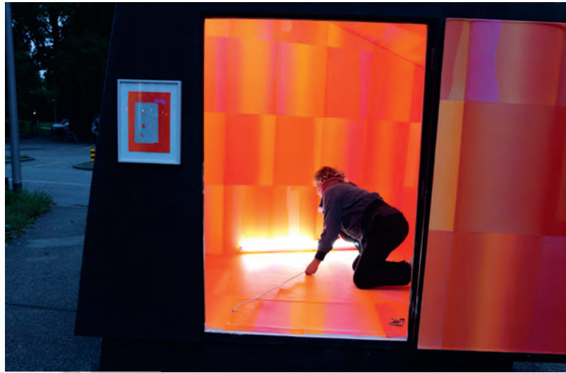
Raffaella Chiara: Surround System , 2022