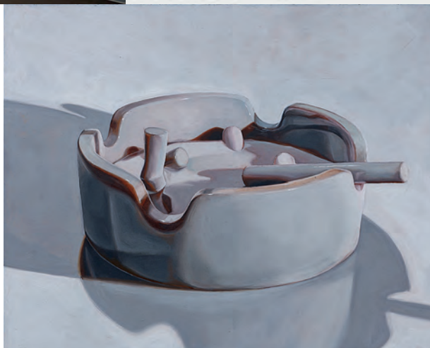
Mattania Bösiger, Objekt_V , 2022