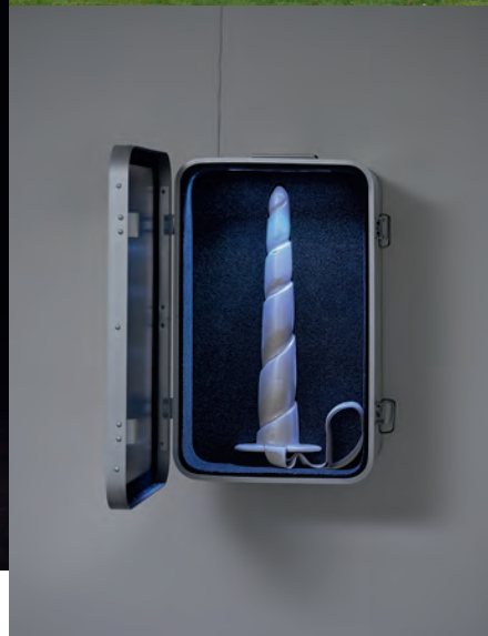
Lorenzo Salafia, first aid kit , 2022