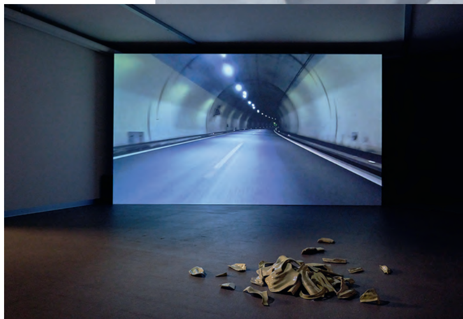
Lorenzo Salafia, tutto passa , 2022 und broken topography , 2022