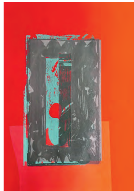
Raffaella Chiara, Surround System , 2022, Auflage 15 und 2 EA, Hochdruck und Siebdruck auf Papier, 29 x 21 cm