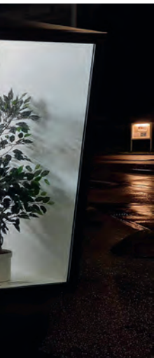
Lea Fröhlicher und Olivia Hegetschweiler: digestiv real , 2023