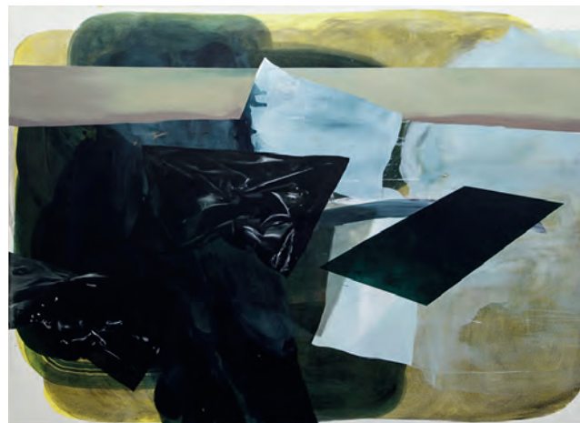
Dimitra Charamandas, Nobody's Trash , 2018 Acryl und Öl auf Baumwolle, 145 x 200 cm

Das Projekt wird im Verlauf dieses Jahres abgeschlossen sein. Diese Grundlagenarbeit hilft uns, einen Überblick über den Zustand der Sammlung zu erhalten, um anschliessend mögliche Massnahmen ergreifen und Projekte zur Sammlungspflege und -vermittlung entwickeln zu können.